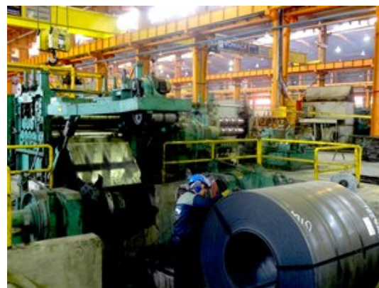
一家位於伊斯法罕的鋼廠

隨著制裁解除，中國國家主席習近平於2016年1月訪問伊朗。訪問期間，兩國就建立25年全面戰略夥伴關係達成協議，在通訊、鐵路、港口、能源、貿易和服務等領域深化合作。未來10年，雙邊貿易額將增加約10倍，超過6,000億美元。