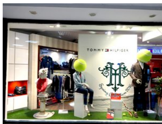
美國服裝品牌在德黑蘭設店

由於美國仍然實施主要制裁，禁止美國公民、公司及金融機構與伊朗營商，因此伊朗與世界其他地區之間的所有交易主要是以美元以外的貨幣進行，尤其是歐元或人民幣。因此，可以用人民幣結算支付的香港公司擁有明顯優勢。