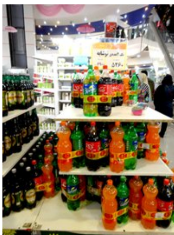
當地超級市場出售可口可樂、雪碧及芬達等非酒精飲品

伊朗人口近8,000萬，超過60%的公民年齡在30歲或以下，是中東北非地區最大的零售市場之一，進口貨品的增長潛力很大。在被制裁期間，伊朗龐大的中產階層仍然偏好外國產品，要從迪拜及土耳其進口來滿足這方面的龐大需求。在聯合國解除制裁後，相關商業活動將隨著貿易及金融正常化而更為方便，預料這股需求將進一步加強。