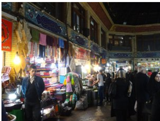
德黑蘭的傳統市集

此外，隨著伊朗的消費市場進一步對國際公司開放，對現代零售設施的需求勢將增加，以滿足懂得科技的年輕消費者的需要。他們越來越喜歡光顧大型購物中心，多於傳統的市集。這種情況可能推動建造業的進一步發展，目前不少新購物設施正在興建，以滿足這方面持續增長的需求。