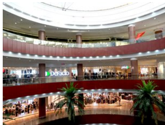
位於設拉子的現代化購物中心