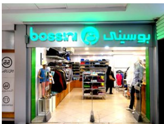
香港服裝品牌在德黑蘭拓展零售業務

在聯合國制裁解除前，伊朗大部分消費者不得不使用質量低劣的「國際產品」，其中不乏假貨。現在制裁已經解除，預料伊朗的零售環境會迅速改變，以回應市場對正牌優質進口貨品被壓抑已久的需求，其中包括電子產品、通訊產品及配件、鐘錶、珠寶、服裝及其他消費品。